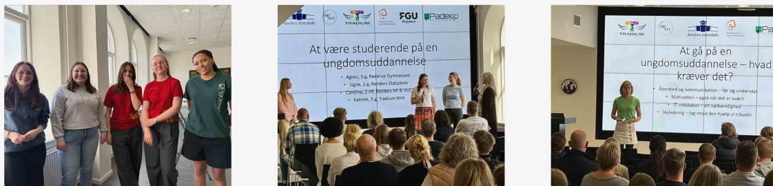
Figur 9. Screenshot fra hjemmesiden www.ordblind-randers.dk.