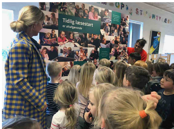
Figur 3. Afsløring af førskolebørnenes egen læseplakat i stort format, 160 x 160 centimeter.

rigtig god opbakning til vores idé. Vi oplever, at børnene ofte peger på billederne og siger: »Det er mig« og »Se min far« – det er tydeligt, at de er begejstrede for plakaten og synes, at situationerne på billederne er hyggelige (fig. 3).