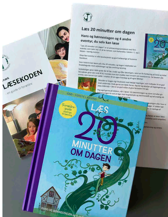
Figur 2. Højtlæsningsbog og læseguide til forældre.

spillere forældrene er i forhold til højt læsning, og hvor afgørende denne tidlige vane kan være for et godt skoleforløb. Indskolingslederen italesætter forventningen om, at forældrene bakker op ved at afsætte tid til den daglige læserutine hjemme.