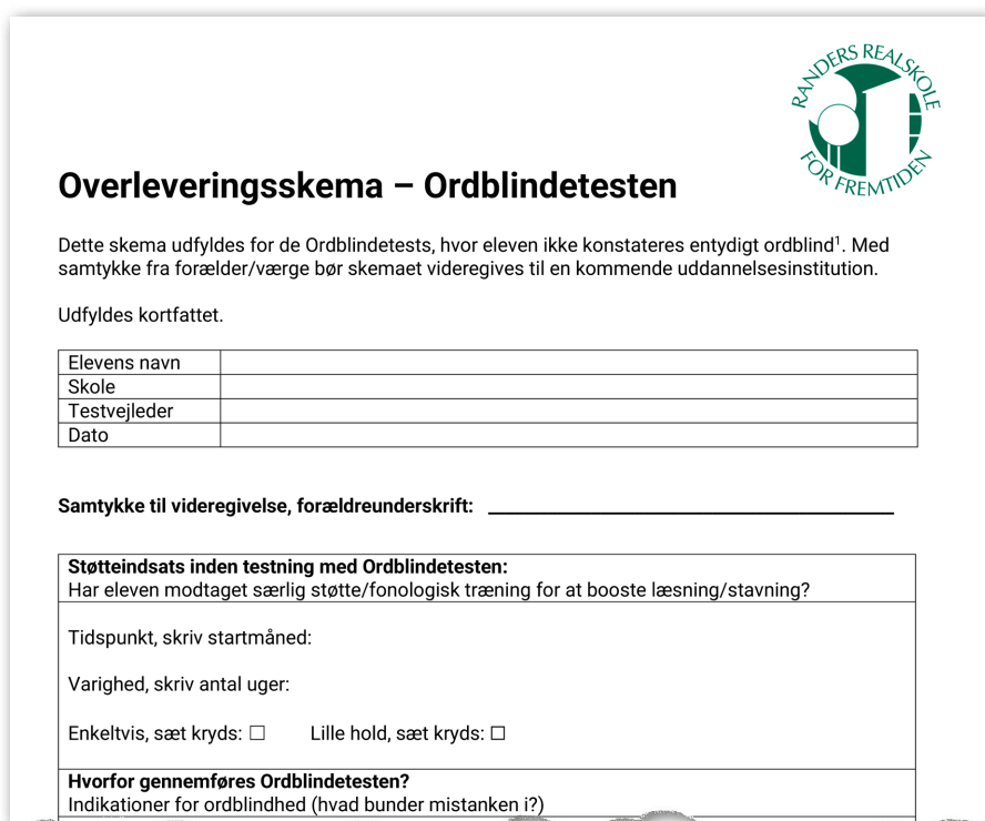
Figur 10. Overleveringsskema, der sikrer, at læsevejlederne på ungdomsuddannelserne har de relevante oplysninger, de skal bruge for at søge SPS. Hele skemaet findes på skolens hjemmeside https://randersrealskole.dk/info/laesevejledning/ under Overleveringsskema .