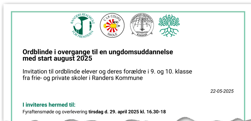
Figur 8. Invitation og dagsorden til overleveringsmødet. Hele figuren findes på skolens hjemmeside https://randersrealskole.dk/info/laesevejledning/ under Invitation til møde for ordblind elever i overgange.

Ungdomsuddannelsernes læsevejledere starter mødet op med overskriften »At gå på en ungdomsuddannelse – hvad kræver det?«. De er flankeret af et ungepanel, der både repræsenterer de forskellige uddannelser, men også forskellige typer af åbne, unge mennesker, som vores elever kan spejle sig i. Oplægget slutter af med information om at gå til eksamen på særlige vilkår og praktiske oplysninger omkring SPS. Herefter er det tid til, at elever og forældre skal møde deres nye læsevejleder, de får set hinanden i øjnene, og der er tid til at stille spørgsmål, forventningsafklare og rådgive om fx valg af sprog. Endelig bliver SPS-ansøgningen klargjort med samtykkeklæringer og aftaler om it og evt. studiestøtte.